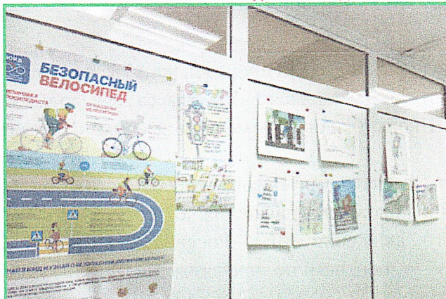
КОНКУРС ПЛАКАТОВ «АЗБУКА ДОРОЖНОГО ДВИЖЕНИЯ»

В рамках МЕСЯЧНИКА по профилактике детского дорожно-